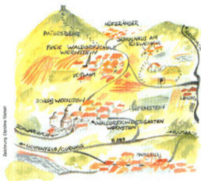
Zeichnung: Cyndrae Nöcker

Waldorfkindergarten Wernstein Schloßberg 8 95336 Mainleus Tel. 09229/97022