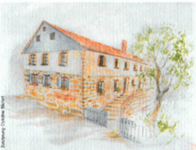
Zeichnung: Cyndrae Nöcker

Glücklicherweise haben wir zwei ausgebildete Erzieherinnen sowie die entsprechenden Räumlichkeiten, was uns ermöglicht, zwei kleine Gruppen statt einer Großen zu führen. Das hat den Vorteil, dass auf jedes Kind individueller eingegangen werden kann.